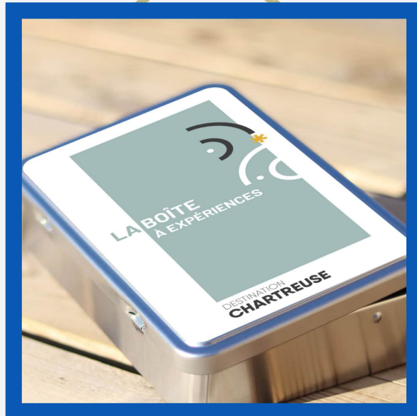
Boite à expériences : 39>189€