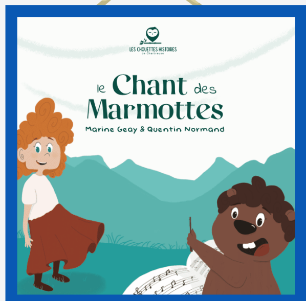
Livres les Chouettes Histoires : 9>12€