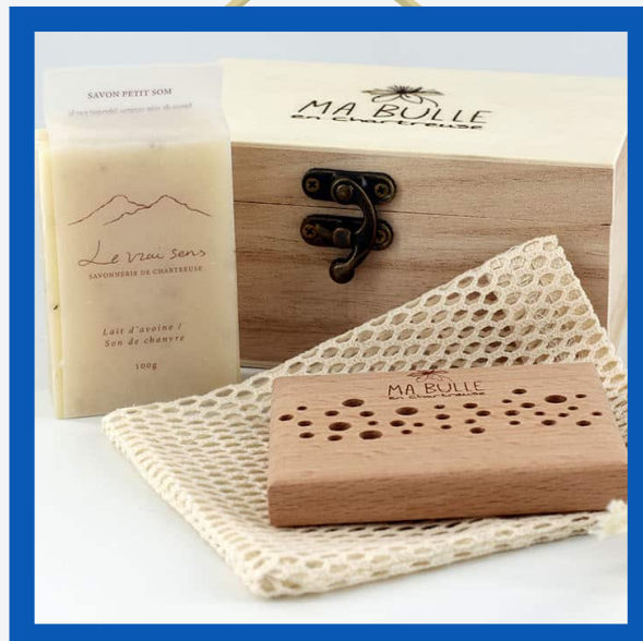
Coffret savon artisanal : 25€