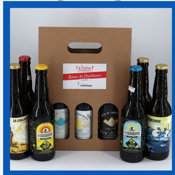
Coffret de bières locales : 13€