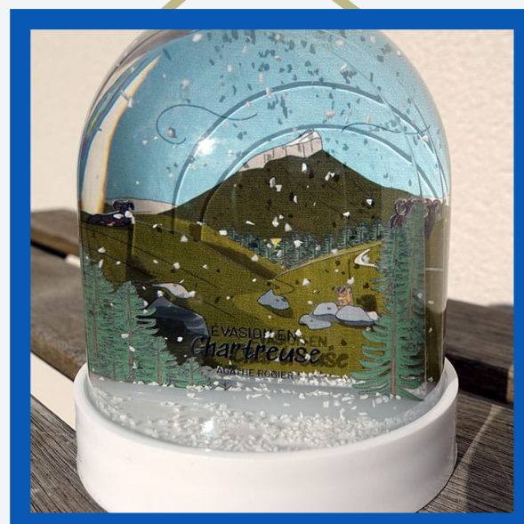
Boule à neige : 7€