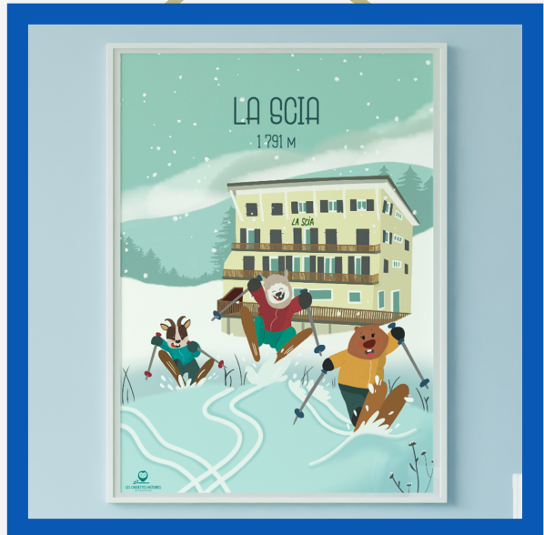
Affiche : 10€