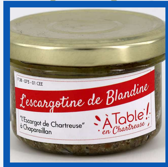
Escargotine : 7€