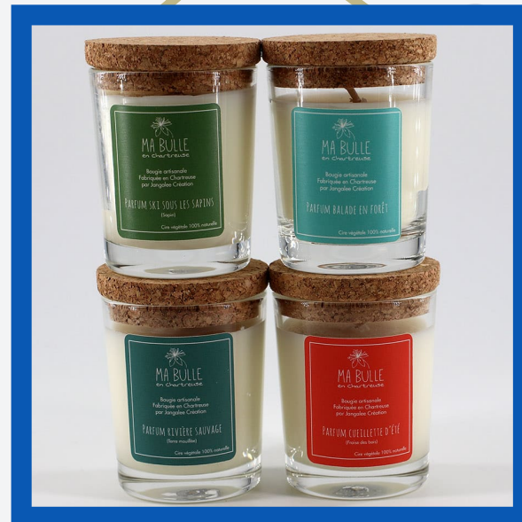
Bougie artisanale : 15,50€