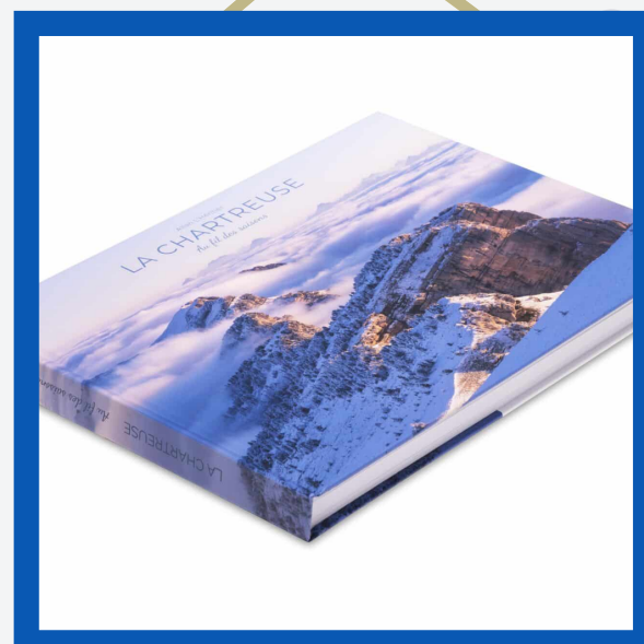
Livre d'Allan L'héritier : 49€

DANS LA LIMITE DES STOCKS DISPONIBLES - L'ALCOOL EST DANGEREUX POUR LA SANTÉ À CONSOMMER AVEC MODÉRATION