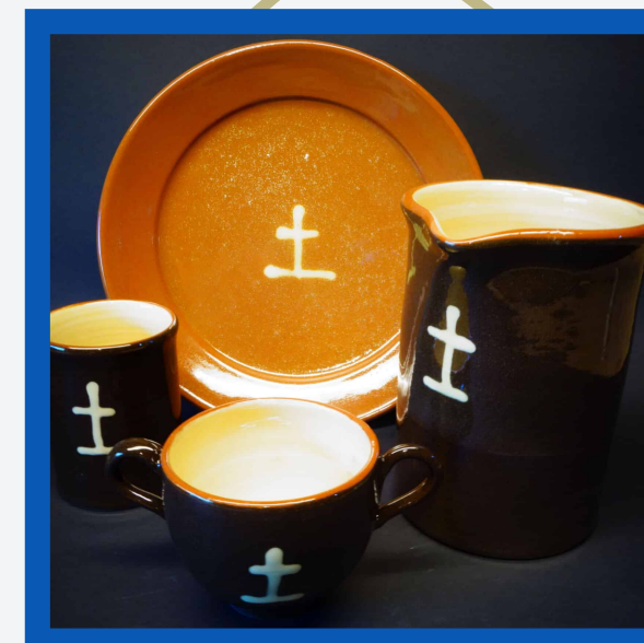
Vaisselle des Chartreux : 15>115€