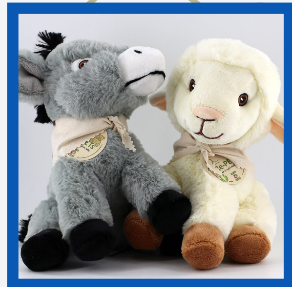
Peluche : 19€