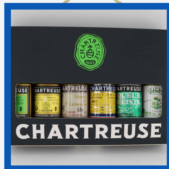
Miniatures Chartreuse : 23€