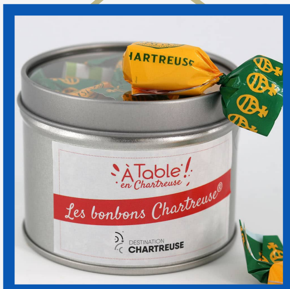
Bonbonnière Chartreuse : 7€