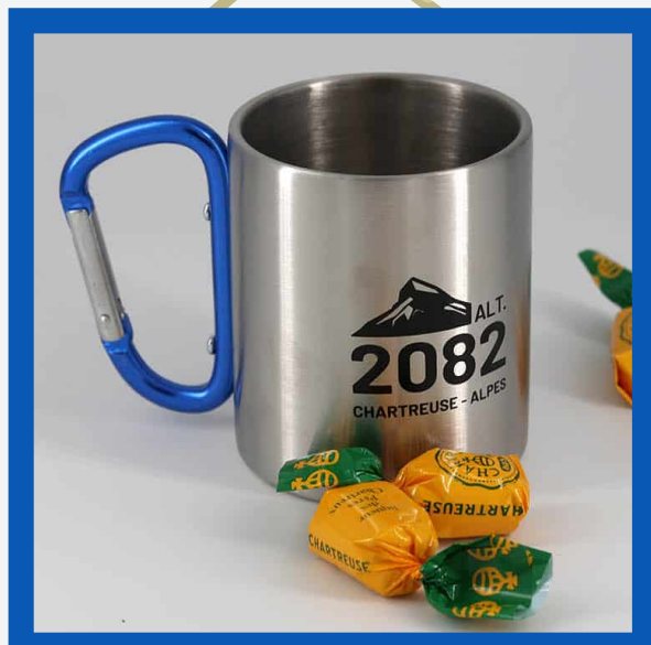
Mug mousqueton : 7€