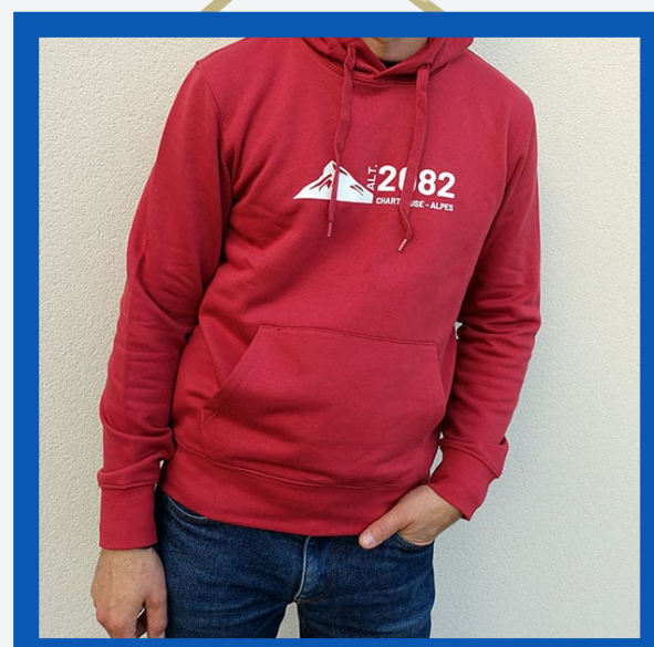
Sweat à capuche : 45€