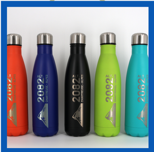
Bouteille isotherme : 23€