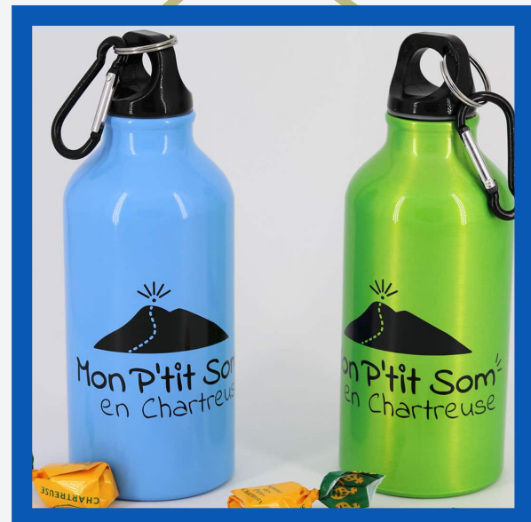
Gourde : 7€