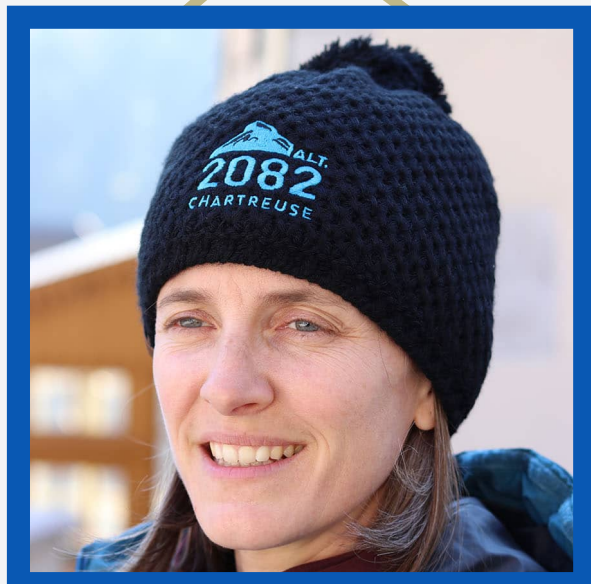
Bonnet : 39€