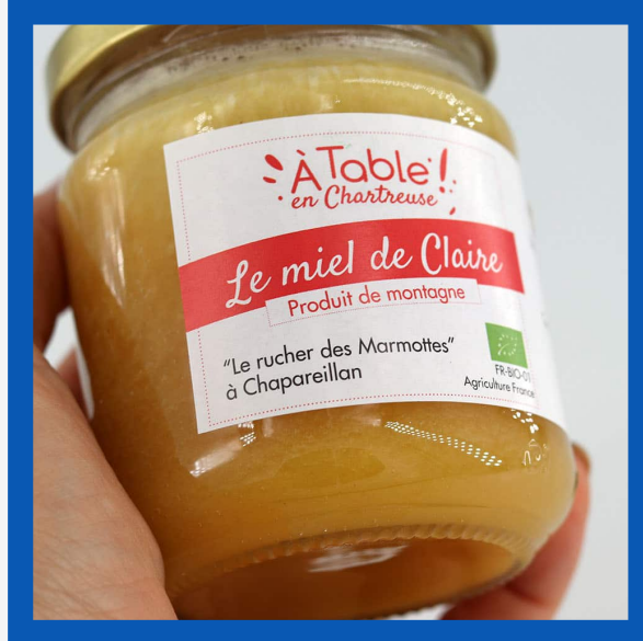
Miel local : 8€