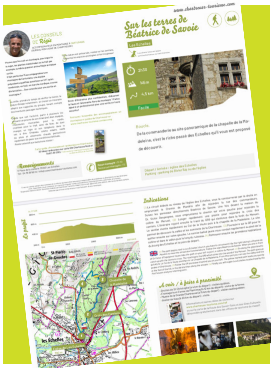
Topoguides - 0,5€

Vous aimez la Chartreuse, ses petits sentiers en sous-bois et ses magnifiques panoramas... Quoi de mieux que vos pieds pour découvrir, à votre rythme, tous les trésors que les 1 300 km de sentiers balisés ont à vous offrir ? Vous randonnez en autonomie ? La règle d'or pour se balader en Chartreuse est de bien préparer son itinéraire ! L'Office de Tourisme Cœur de Chartreuse vous propose différents supports dédiés à la randonnée.