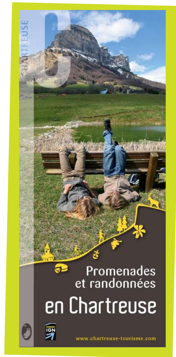
Carte de randonnée - 7€